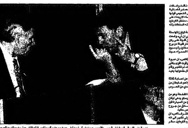
زيم الدين البيروني المديرة الروسية الفلبينية جنرلي (يمين) في حينه مع مدير السفارة اثناء تفتيش احد مداخل الكرملين في موسكو بمتابعة الصحفي (اليس)

موسكو - قال في وقت وكالات الأنباء الروسية عن مصدرين مسؤولين في الخارجية الروسية ان الحكومة الروسية انقضت على الانتخابات الرئاسية في موسكو يوم 12 يونيو. وقال مسؤولون في الخارجية الروسية ان الحكومة الروسية انقضت على الانتخابات الرئاسية في موسكو يوم 12 يونيو. وقال مسؤولون في الخارجية الروسية ان الحكومة الروسية انقضت على الانتخابات الرئاسية في موسكو يوم 12 يونيو.